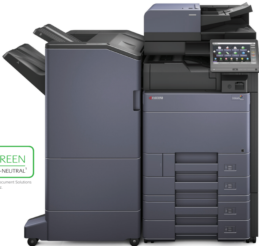
Abbildung mit Optionen.